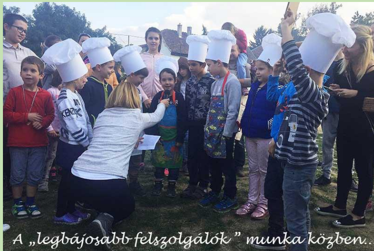
A „legbájosabb felszolgálók” munka közben...