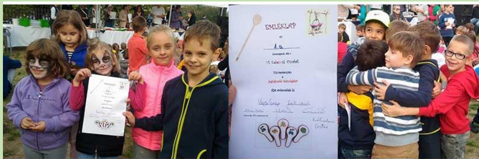
Oklevél, és a siker öröme!