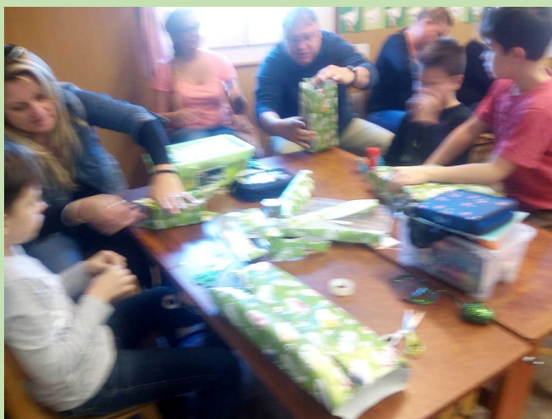
Bemutató óráinkon készült alkotásaink: